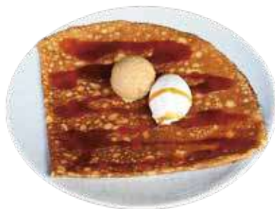
カレモンキャラメル