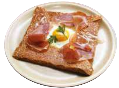
コンプレット オ ジャンボンクリュ

Raw ham “complète” コンプレット オ ジャンボン クリュ ..... ¥ 1,680