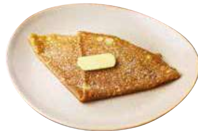
北海道産バターとブラウンシュガー

Salted butter caramel was invented in Quiberon in the mid-1950s.