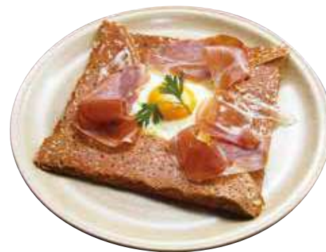
コンプレット オ ジャンボンクリュ

Raw ham “complète” コンプレット オ ジャンボン クリュ ..... ¥ 1,650