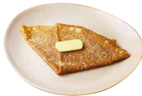
北海道産バターとブラウンシュガー

Salted butter caramel was invented in Quiberon in the mid-1950s.