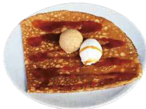
カレモン キャラメル