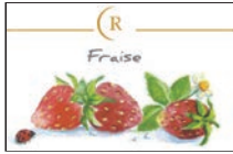
fraise de Plougastel

好きなジャムをお選びください(苺、イチジク、リubarbe または オレンジマーマレード)